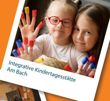
Integrative Kindertagesstätte Am Bach